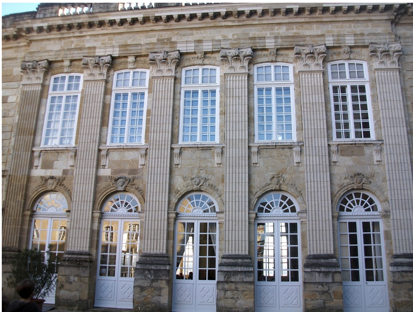
Façade de la préfecture.

Pour écouter les explications cliquez sur : L'Hôtel des archevêques