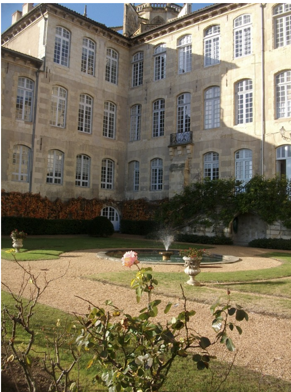
▲ Les jardins.