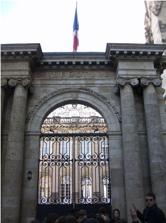
▲ Entrée de l'hôtel.