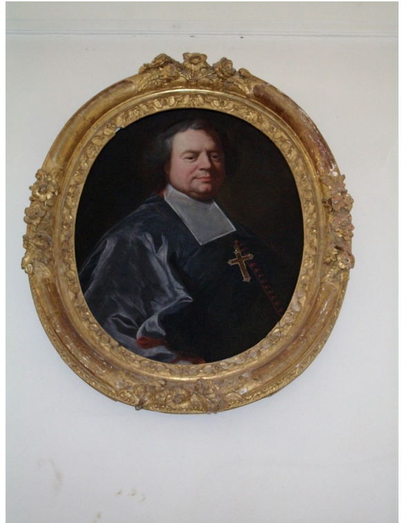
▲ Monseigneur de Maupéou.