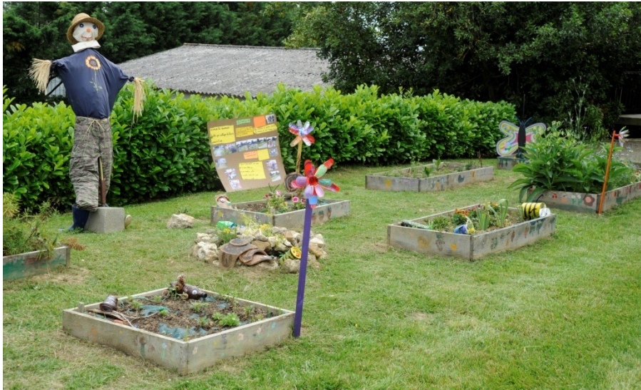
École de Lannepax, juin 2021